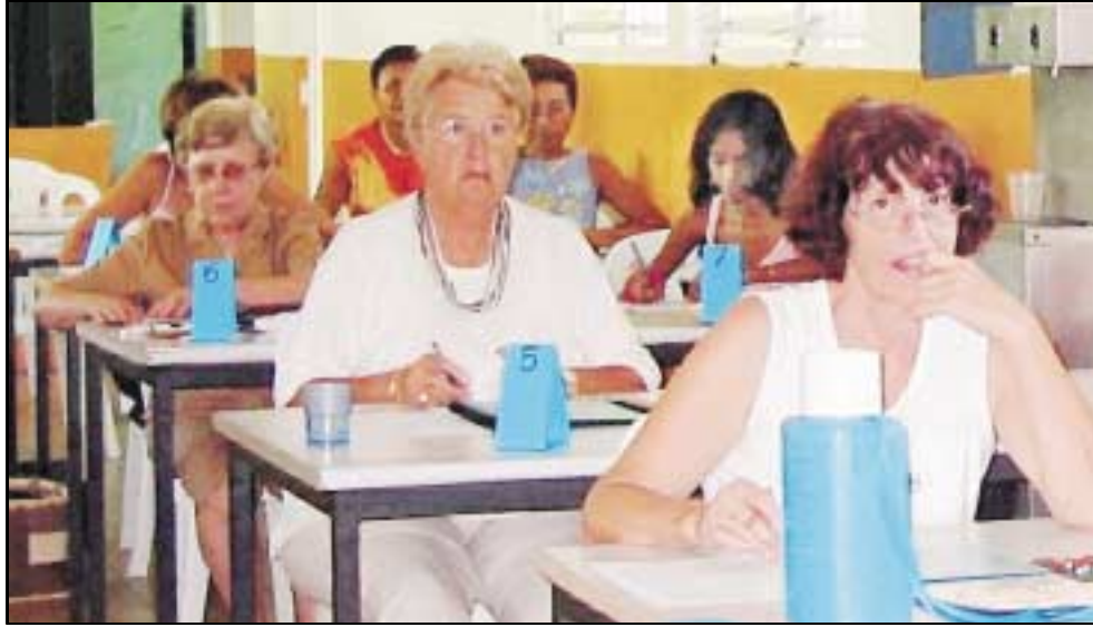
Derrière les meilleurs, la majorité des scrabbleurs locaux viendra pour réussir une bonne coupe de Cannes.